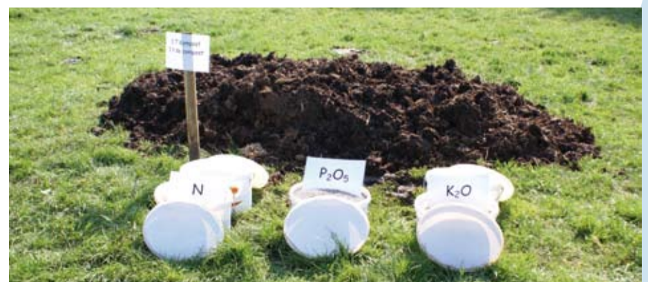
Tableau 3 : Valeur des engrais de ferme pour N, P 2 O 5 et K 2 O