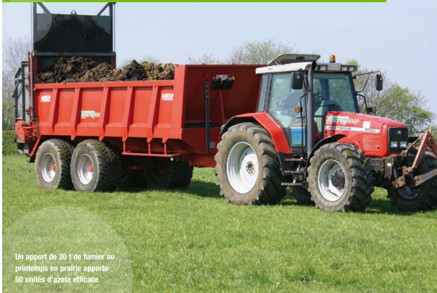
Un apport de 20 t de fumier au printemps en prairie apporte 50 unités d'azote efficace